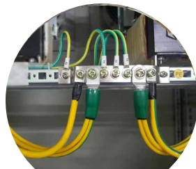
IMPIANTI DI MESSA A TERRA